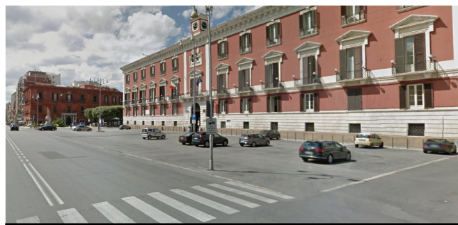
Piazza Libertà a Bari

Il cantautore napoletano salirà sul palco allestito nel centro storico di Bari a partire dalle ore 21.00. Assieme a Gigi D'Alessio si esibirà anche la sua compagna Anna Tatangelo , ma il cast è particolarmente ricco. Si va da Bianca Atzei a Nek , passando per la band rivelazione di quest'anno, The Kolors con Stash , a quella della passata stagione di Amici, ovvero Dear Jack . I più giovani potranno ascoltare anche la musica rap di Briga . Negli ultimi giorni il parterre di artisti si è arricchito della presenza di Dolcenera e Gianluca Grignani .