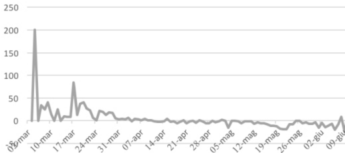
VARIAZIONE PERCENTUALE CONTAGI