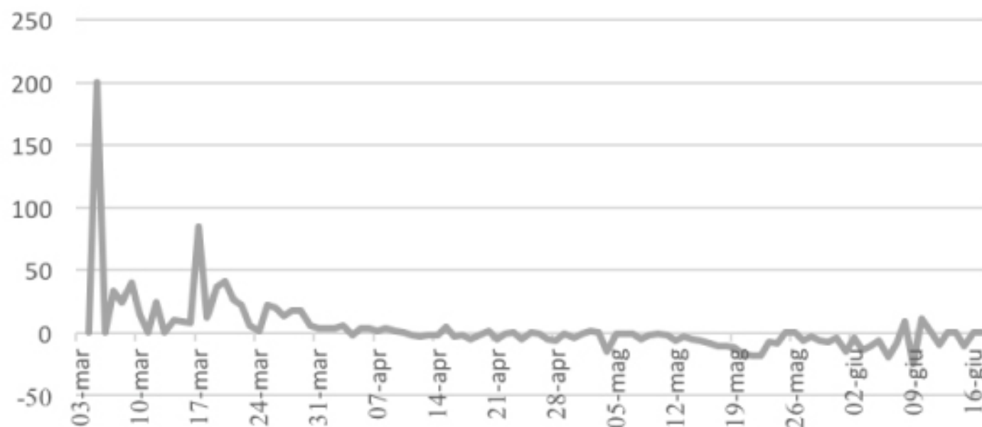
VARIAZIONE PERCENTUALE CONTAGI