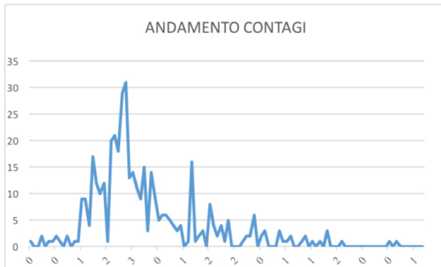
GRAFICO ANDAMENTO CONTAGI