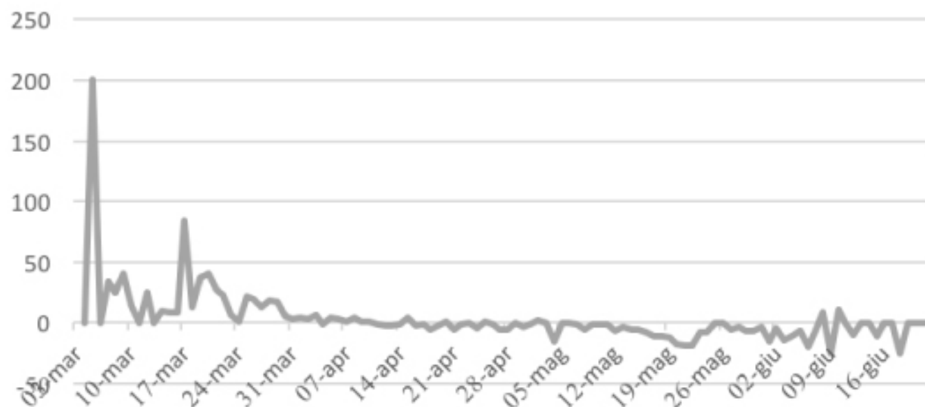
VARIAZIONE PERCENTUALE CONTAGI