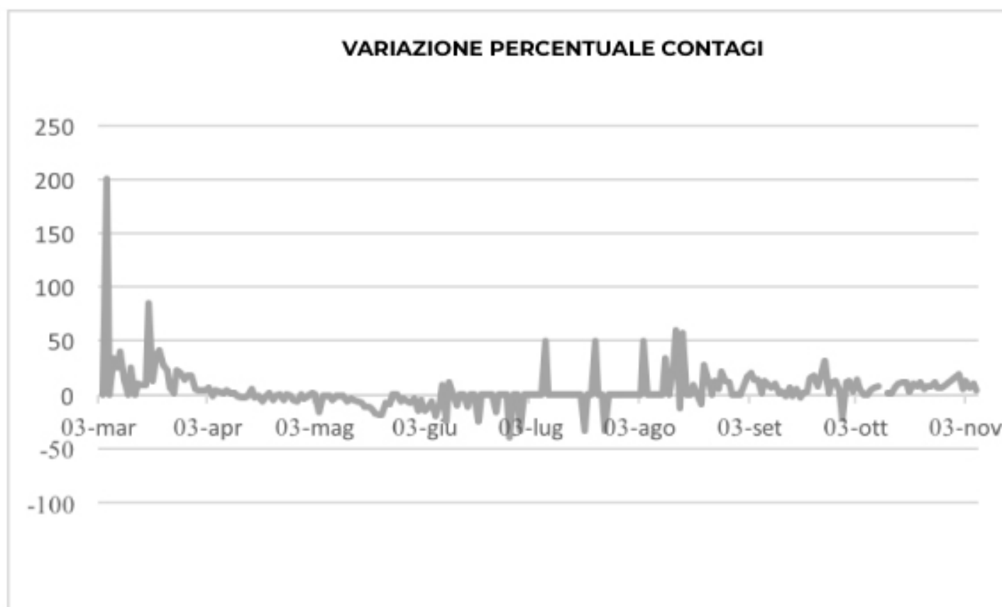
GRAFICO VARIATIONE PERCENTUALE CONTAGI