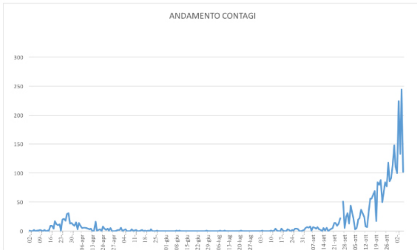
GRAFICO ANDAMENTO CONTAGI