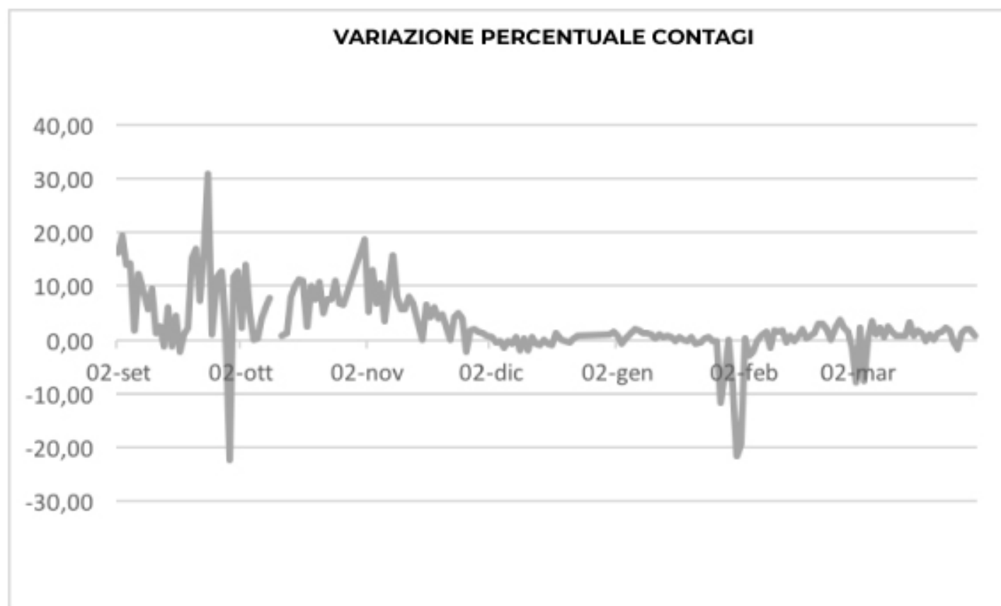
GRAFICO VARIAZIONE PERCENTUALE CONTAGI